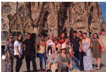
Séjours professionnels à l'étranger.