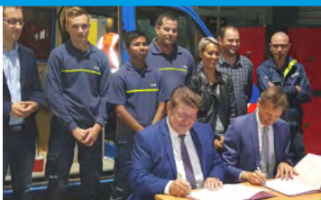
Renouvellement des conventions de partenariat avec ENEDIS et SUEZ.