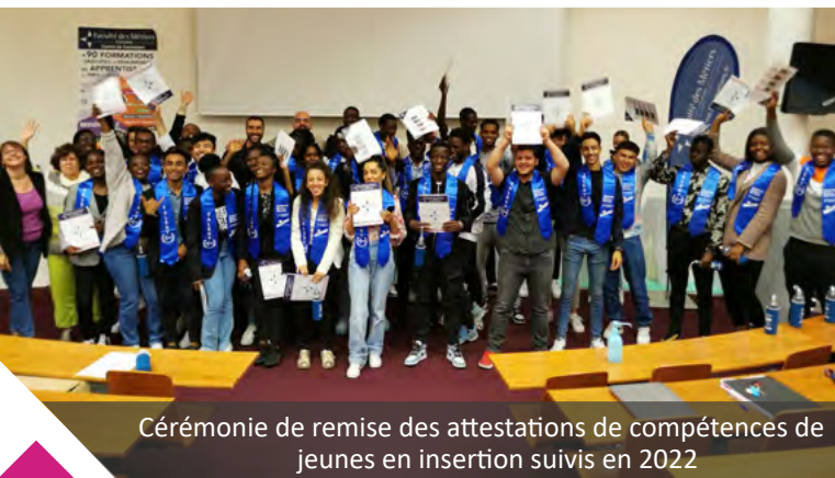
Cérémonie de remise des attestations de compétences de jeunes en insertion suivis en 2022

*Depuis 2010, la mission Handicap œuvre pour l'égalité des chances dans l'accès à la formation et à l'emploi des PSH et a accompagné 1 383 personnes.