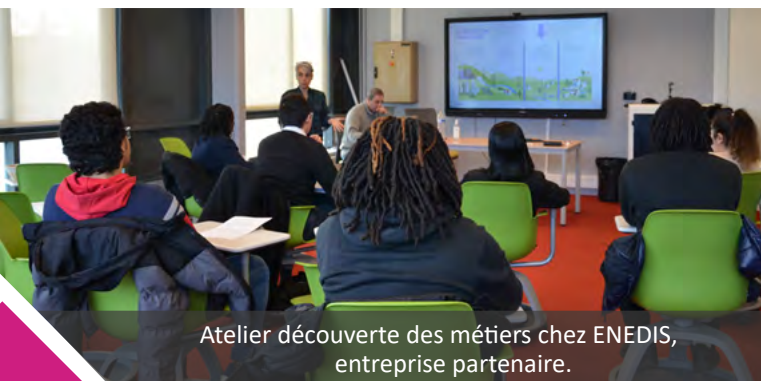
Atelier découverte des métiers chez ENEDIS, entreprise partenaire.